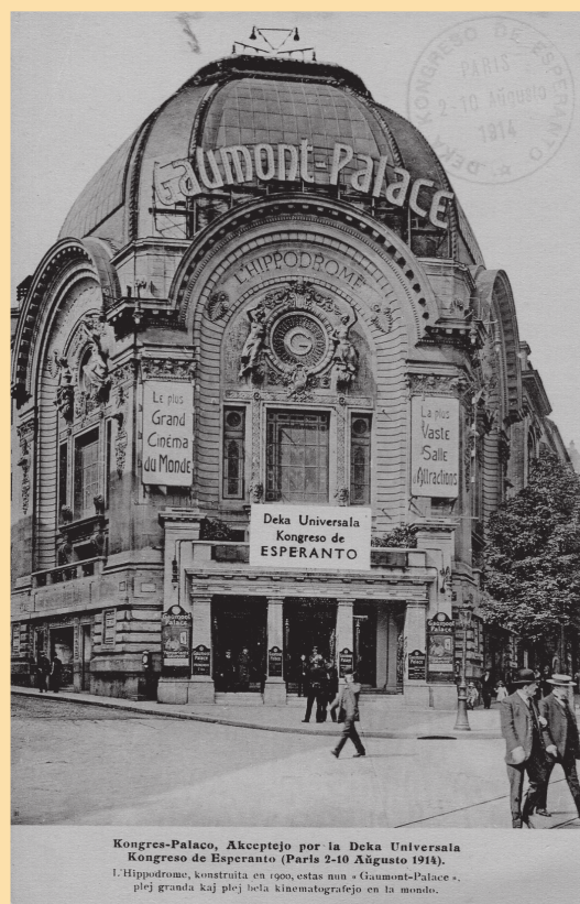
Kongres-Palaco, Akceptejo por la Deka Universala Kongreso de Esperanto (Paris 2-10 Aŭgusto 1914). L'Hippodrome, konstruita en 1900, estas nun « Gaumont-Palace », plej granda kaj plej bela kinematografitejo en la mondo.