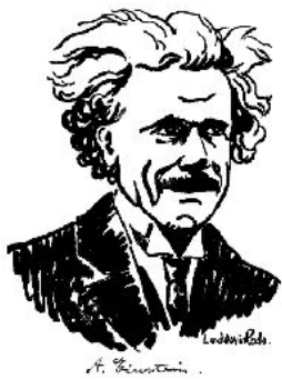
Portrait d'Albert Einstein par Ludovic Rodo (Ludovic-Rodo Pissarro) cinquième enfant de Camille Pissarro.

14 juin 1923 : Albert Einstein, accepte la présidence d'honneur du congrès mondial de SAT dont la langue de travail est l'espéranto et dont la devise est "SAT-anoj kutimiĝu al eksternacia sent-pens-kaj agad-kapablo !" 1